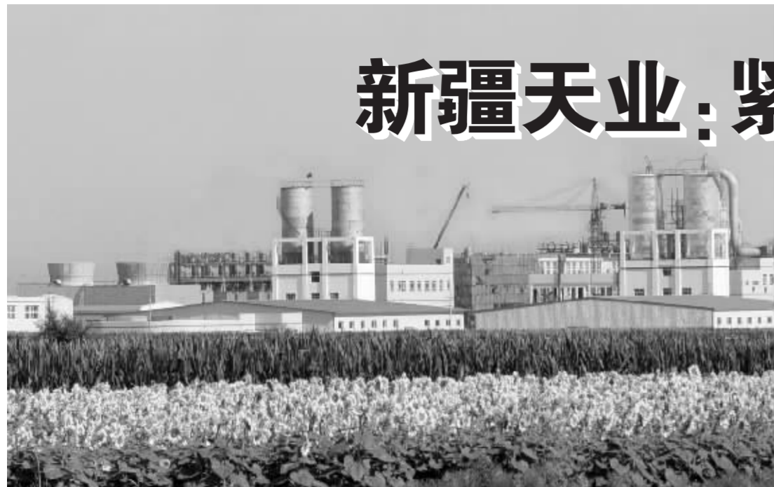
新疆天业20万吨聚氯乙烯厂